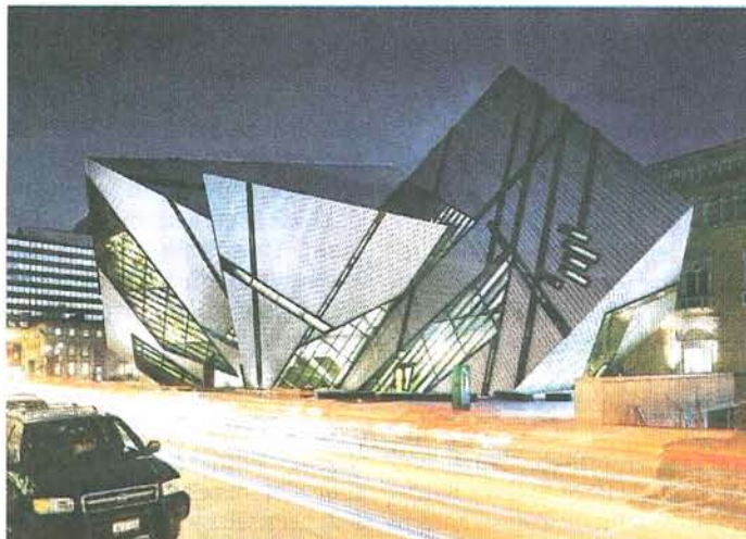
2007 entstand das Royal Ontario Museum in Toronto. Es fügt sich kaum in die Umgebung ein – sondern scheint ihr zu entfliehen. Foto: Royal Ontario Museum