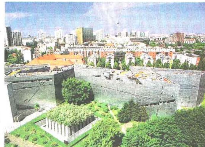
In Deutschland wurde Daniel Libeskind mit dem Jüdischen Museum in Berlin bekannt. Der zerbrochene Davidstern wurde 1999 fertiggestellt.